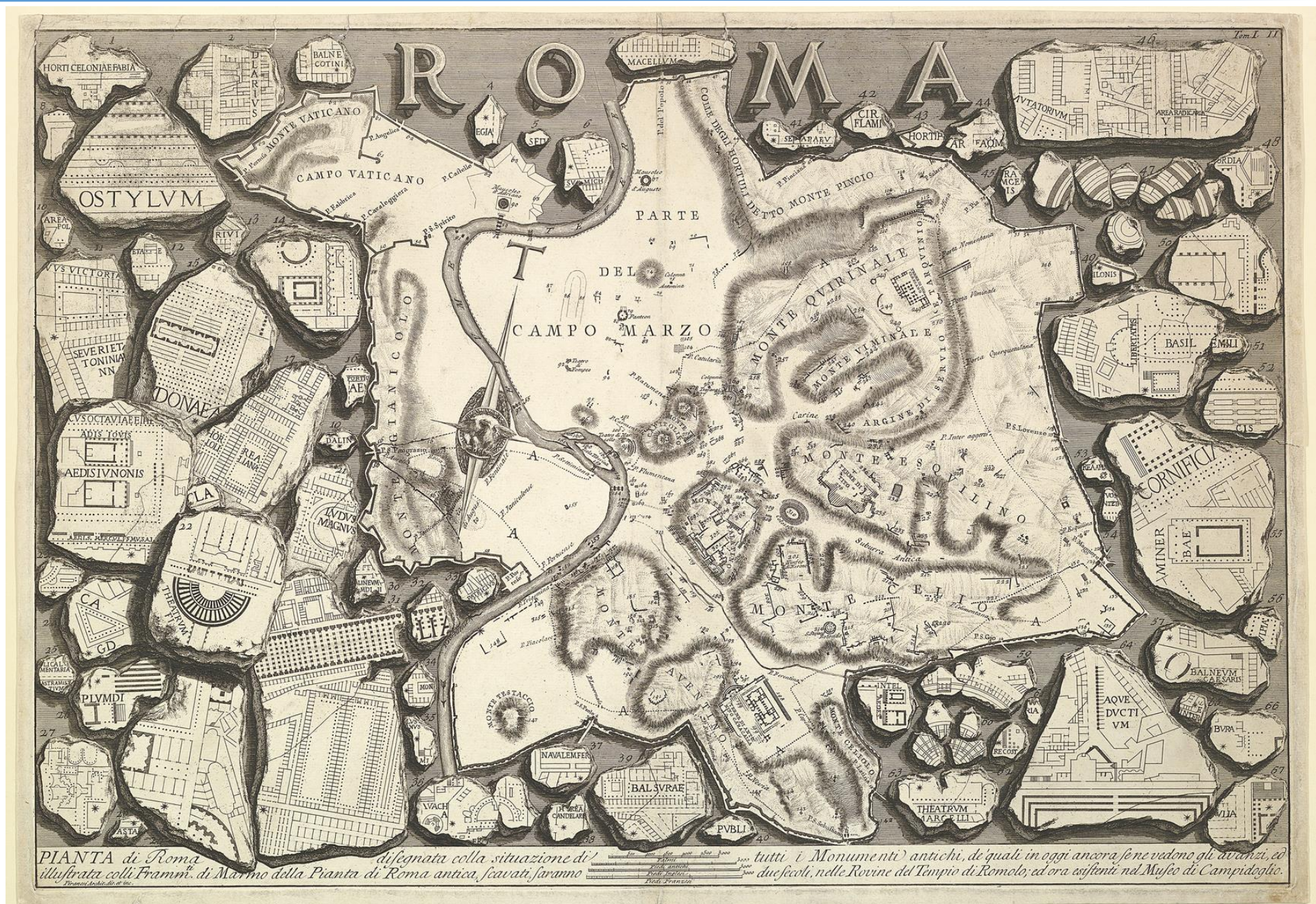
PIANTA di Roma disegnata colla situazione di tutti i Monumenti antichi, de quali in oggi ancora se ne vedono gli avanzi, ed illustrata colli Frammenti di Marmo della Pianta di Roma antica, scavati saranno due secoli, nelle Rovine del Tempio di Romolo; ed ora esistenti nel Museo di Campidoglio.